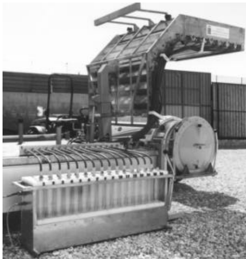
Fig. 4 – Banco di misura connesso alla parete captante. <Times New Roman 10, corsivo>