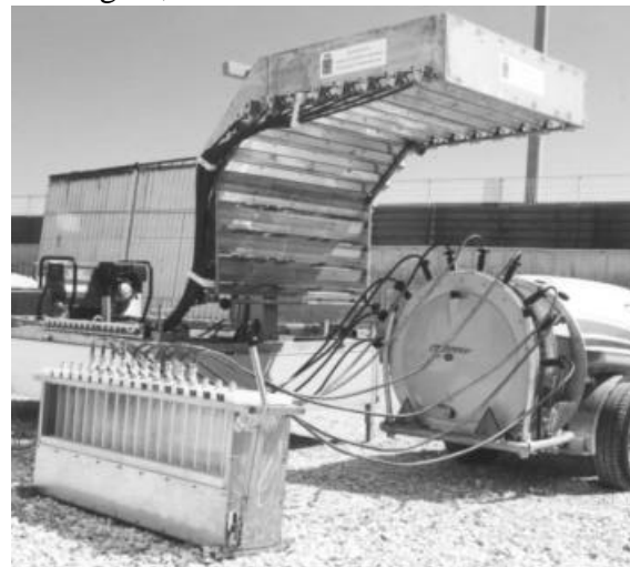
Fig. 5 – Banco di misura connesso agli ugelli.